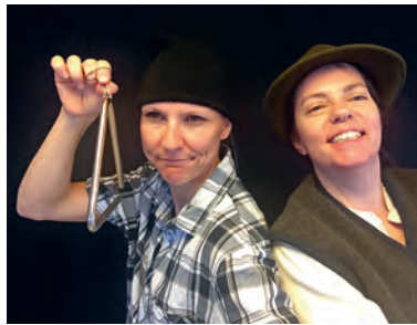
Triangel-Ursli war zu Gast in Freienbach.