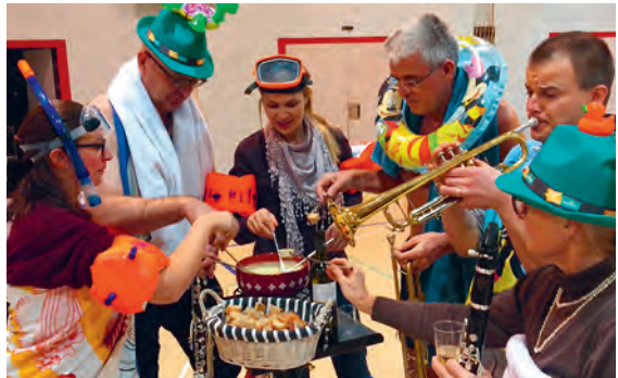
Fondue gibt gute Laune!