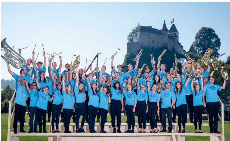
Das Jugendblasorchester Höfe feiert seinen Erfolg in Burgdorf.

Sich zu messen gehört zum Musik machen wie zum Sport treiben. Dass dies die jugendlichen Nachwuchsmusiker des Bezirks Höfe mit Enthusiasmus tun, stimmt zuversichtlich für die Zukunft. Im nächsten Jahr findet für die Erwachsenenvereine im Rahmen des «Fests der Musik» in Lachen und Altendorf das Kantonale Musikfest statt. Und übernächstes Jahr steht das Eidgenössische Musikfest in Interlaken an. Es ist zu hoffen, dass die Höfner Musikvereine, allen voran natürlich die Harmonie Freienbach, ihrem Nachwuchs in nichts nachstehen.