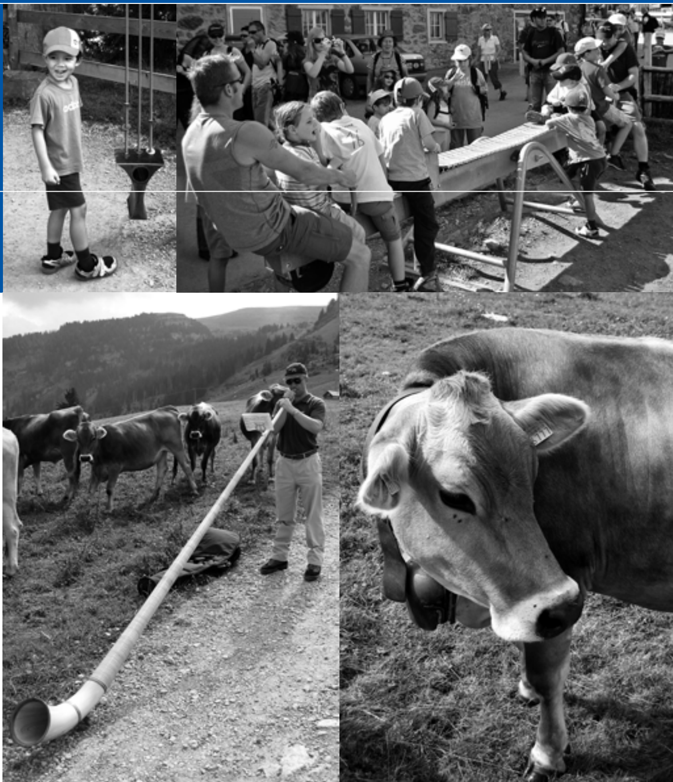
Die Harmonie Freienbach erfreute sich an den Klanginstallationen und trug auch selber etwas zur musikalischen Unterhaltung der Ausflügler bei.