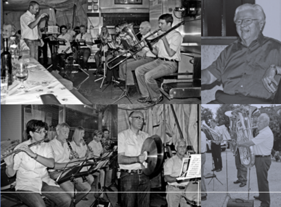
Die Kolleginnen und Kollegen gratulieren den Geehrten mit einem Ständli.

Anfangs September war es soweit. Das interne Fest der Geehrten und Geburtstagskinder der Harmonie Freienbach konnte steigen.