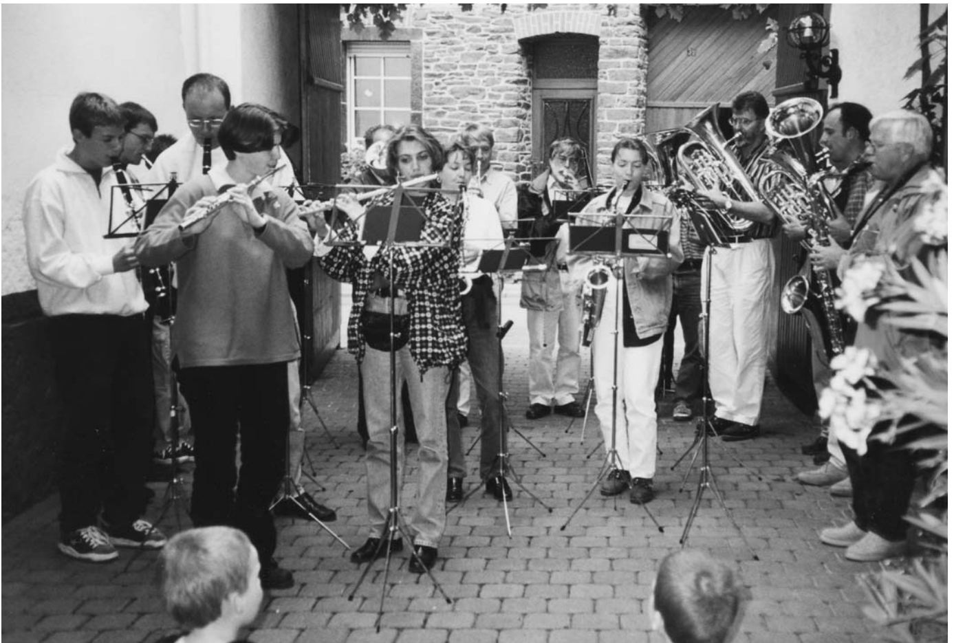
Die vereinseigene Unterhaltungsband bei einem ihrer Einsätze.