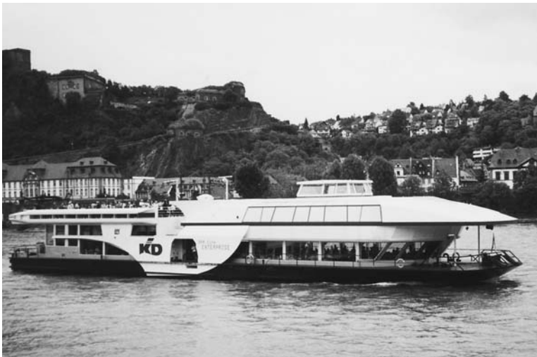
Auf dem modernen Schiff «Enterprise» genossen wir ein feines Mittagessen.