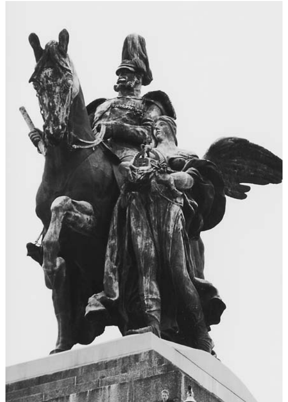
Das gewaltige Reiterstandbild im deut- schen Eck, welches die umliegenden Bäume um mehrere Meter überragt.

kapelle liess uns den Nieselregen vergessen und verhalf zu guter Stimmung. In Koblenz stiegen wir auf das supermoderne Moselschiff «Enterprise» um. Nach einem mit viel Schwung servierten Mittagessen gingen wir in Winnigen von Bord. Die anschliessende Degustation von Weinen aus der Umgebung war vor allem für unsere Weinkenner ein interessantes Erlebnis. Beim Dankeschön-Ständchen griff sogar der Weinbauer selber zu seinem Tenorhorn und blies mit uns den «Gruss ans Höfnerland». Diesmal waren vor allem die Bläser und nicht die Instrumente gut geölt, wie die Musikantenfrauen übereinstimmend feststellten.