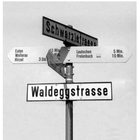
Wegweiser für die Zukunft: das neue Leitbild.

Mit dem Leitbild wollen wir unsere Attraktivität weiter stärken und die Zukunft sichern. Das Leitbild ist die Basis für unseren Verein. Es zeigt Aufgaben und Herausforderungen auf, beschreibt den Weg und gibt die Ziele bekannt. Wir wollen mehr tun, als uns nur einmal in der Woche treffen. Wir möchten, dass Sie uns als zeitgemässen, beweglichen Verein erleben. Wir wollen gemeinsam etwas erreichen, und dazu brauchen wir eine gut eingespielte Mannschaft, die ihr Bestes gibt und gemeinsam einen Kurs ansteuert. Wir wollen auch in Zukunft initiative und engagierte Mitglieder, die sich rege am Vereinsleben beteiligen und sich bei uns wohl und integriert fühlen.