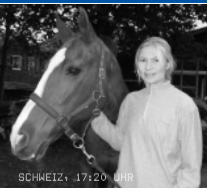
SCHWEIZ, 17:20 UHR