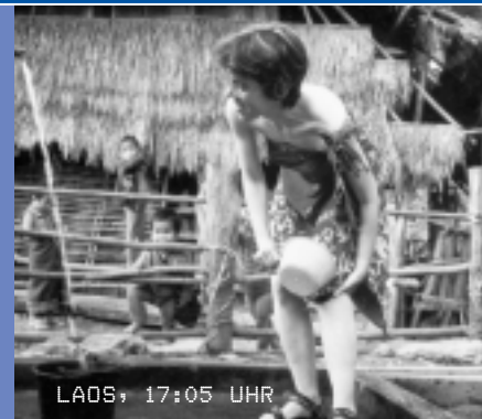
LAOS, 17:05 UHR

WELCHES WAR DEIN EINDRÜCKLICHSTES FERIENERLEBNIS? Nordöstlicher Zipfel von Laos, am Ende eines anstrengenden Trekkingtages: Meine Reisegenossin und ich sehnen uns nach nichts mehr als einer Dusche. Als einzige Möglichkeit bietet sich der Dorfbrunnen an. Und so waschen wir uns – oder versuchen es zumindest – unter den neugierigen und kritischen Blicken vieler Kinderaugen. Eingewickelt in den traditionellen Sarong natürlich. Da ist eine normale «Chübeldusche» gerade ein Luxus!