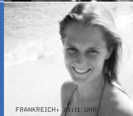
FRANKREICH, 14:11 UHR

WELCHES WAR DEIN EINDRÜCKLICHSTES FERIENERLEBNIS? Dazu zähle ich meine Reise nach Hawaii. Da meine Schwester einen dreimonatigen Englischaufenthalt in Honolulu machte, war es für mich eine einmalige Gelegenheit dorthin zu reisen. In diesen drei Ferienwochen feierte ich zusätzlich meinen 20. Geburtstag an endlos, weissen Sandstränden auf der Insel Kanai.