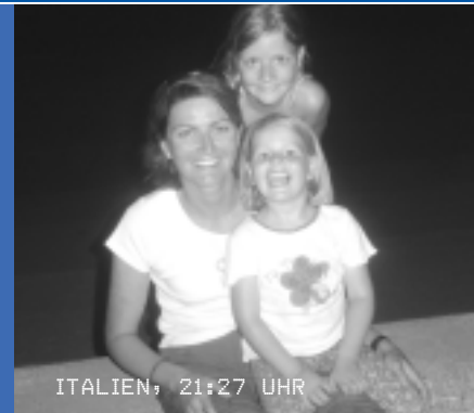
ITALIEN, 21:27 UHR

WELCHES WAR DEIN EINDRÜCKLICHSTES FERIENERLEBNIS? Zu meinen eindrücklichsten Ferienerlebnissen zähle ich unsere Hochzeitsreise in die USA. Während unserer mehrwöchigen Reise besuchten wir die Städte San Fransisco und Las Vegas und statteten Naturschönheiten wie Grand Canyon, Bryce Canyon und Death Valley einen Besuch ab. «Das muesch gseh ha!»