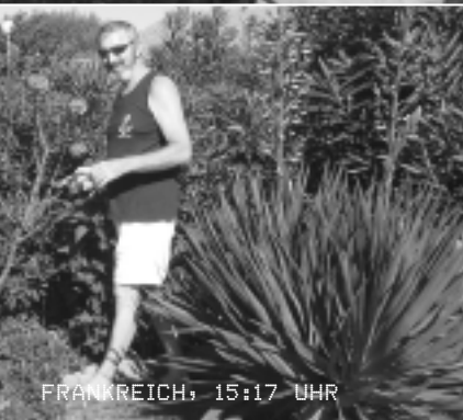
FRANKREICH, 15:17 UHR