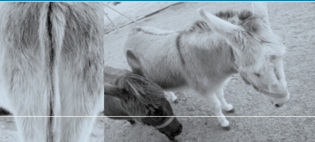
Die Zwergesel Benjamin und Alijosha, zwei eigenwillige und unzertrennliche Veteranen im Zirkus Monti.