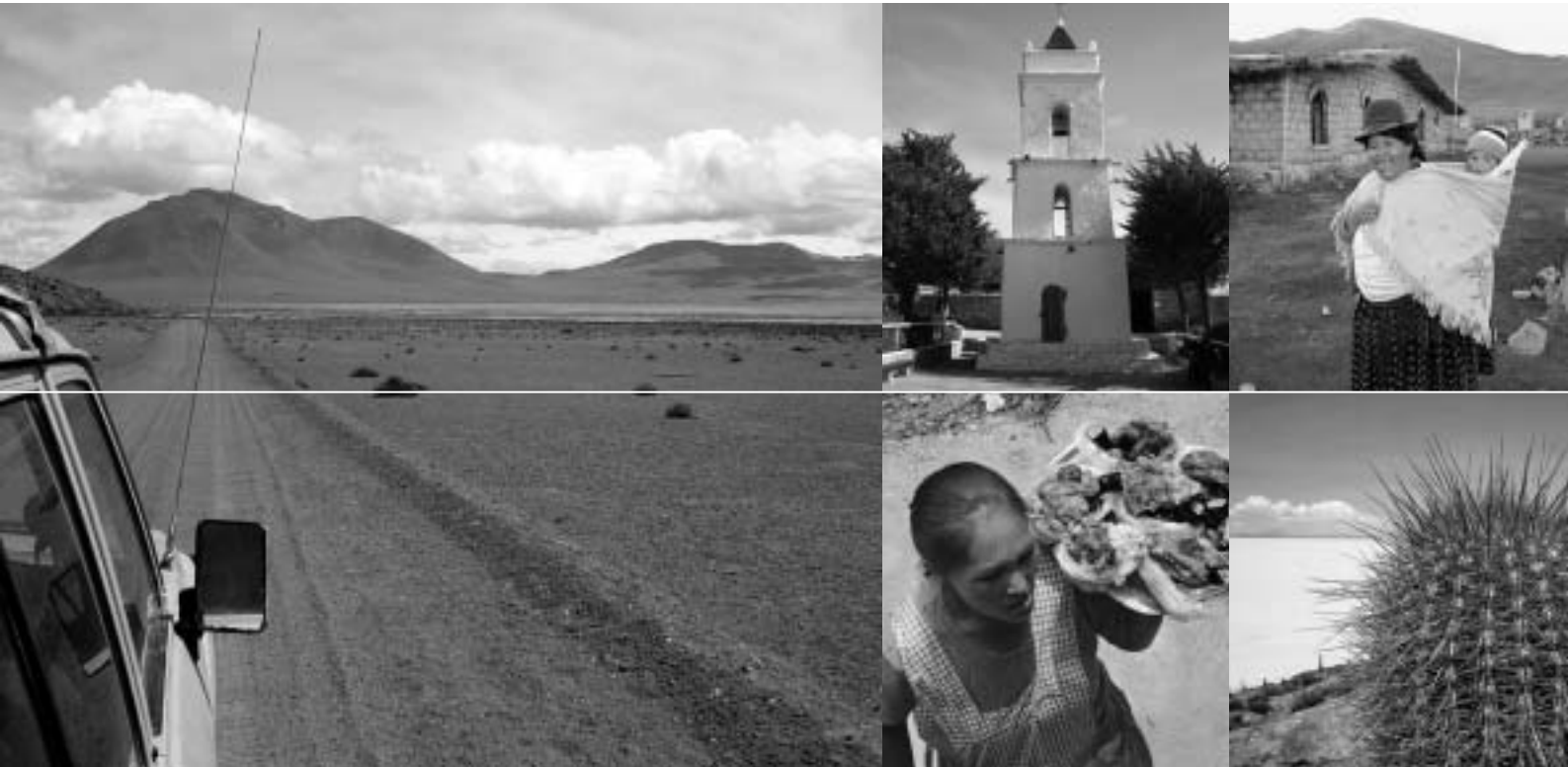
Südamerika pur: Faszinierende Landschaften, Begegnungen mit Einheimischen und «rumplige» Schotterpisten.

wurde und ich ihn nicht mehr sah. Konnte ich nur hoffen, dass ich ihn am Ende der Busfahrt wieder bekam, da unterwegs immer wieder Sachen auf- und abgeladen wurden. Ausserdem musste ich mich sehr an die dürftigen sanitären Einrichtungen gewöhnen. Irgendwie hatte ich das Gefühl, ich befände mich im Land ohne Toiletten, was etliche Male fast zu einem Desaster geführt hätte. Für die bolivianischen Frauen mit ihren vielen Röcken war das absolut kein Problem.